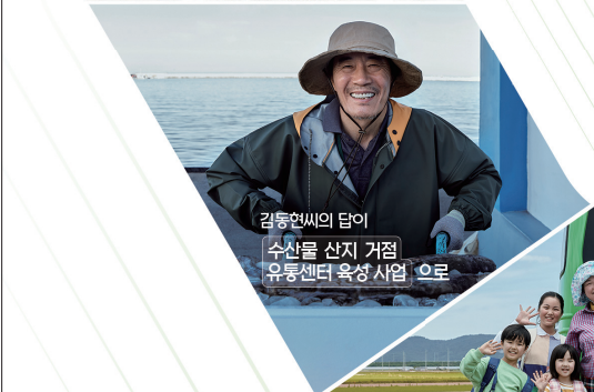
김동현씨의 답이 수산물 산지 거점 유통센터 육성 사업 으로