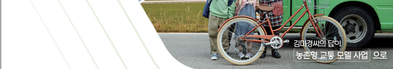
김마경씨의 답이 농촌형 교통 모델 사업 으로