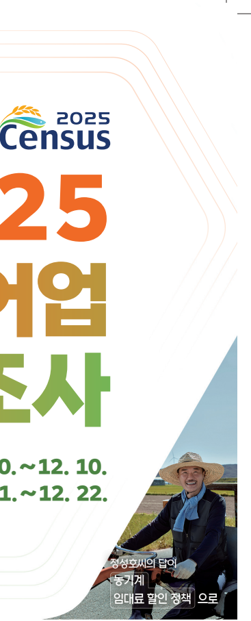
정성호씨의 답이 농기계 임대료 할인 정책 으로