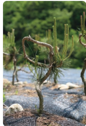
분재용 - 화훼